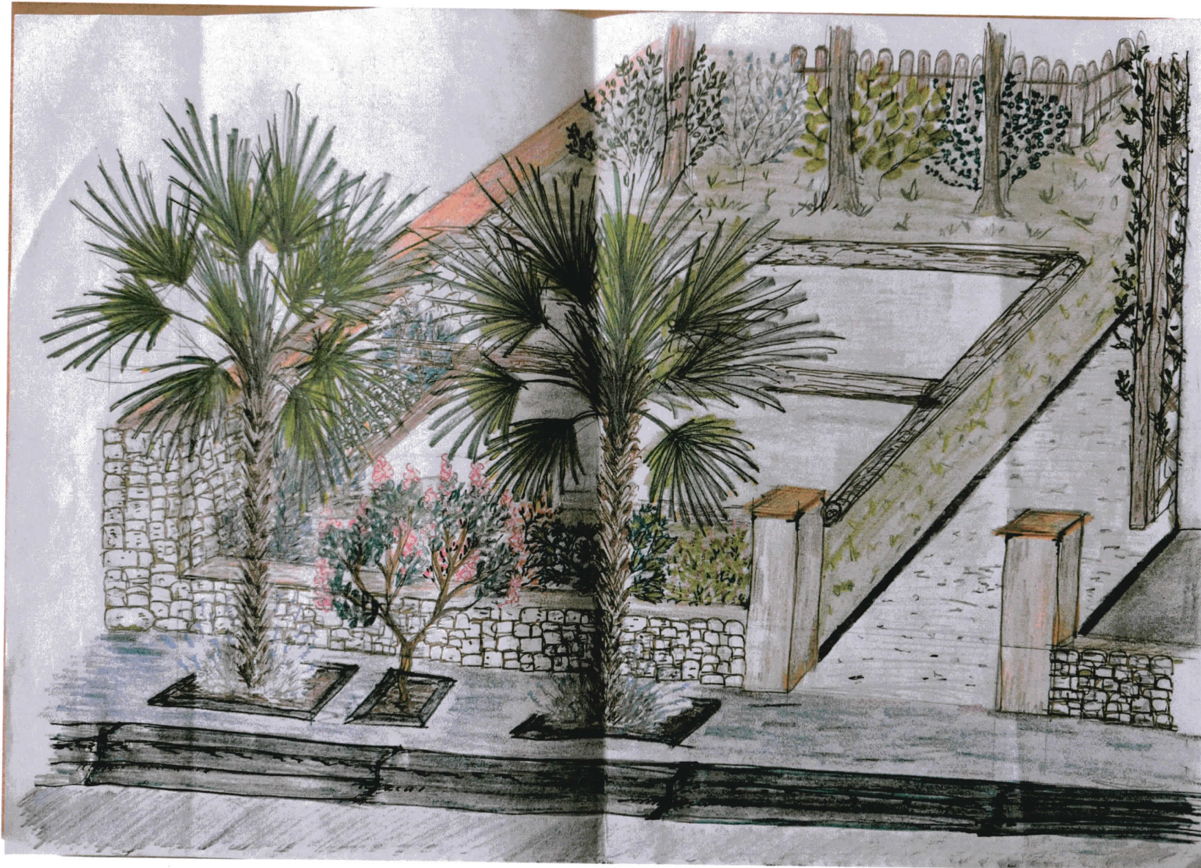
Avant projet réalisé par Damien Carriot